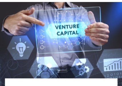
یک حساب کاربری ایجاد کنید

ما یک شرکت مالی بین المللی هستیم که در زمینه سرمایه گذاری فعالیت می کنیم فعالیت هایی که مربوط به تجارت در بازارهای مالی و مبادلات ارزهای دیجیتال توسط معامله گران حرفه ای واجد شرایط انجام می شود.